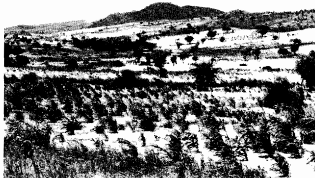
Vallée nigérienne au Sud de Gourou. Illustrant le processus de désertification.