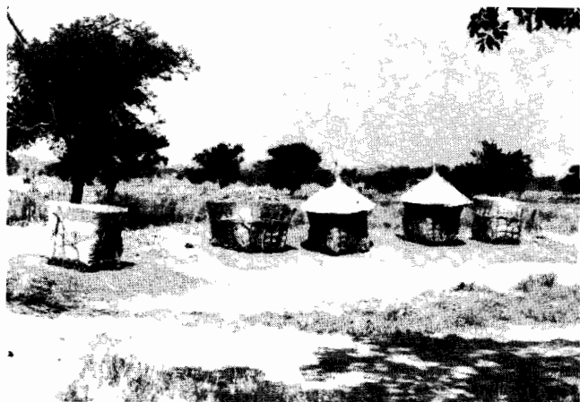
Greniers à grain sahéliens.